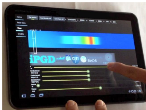
Image: Défis rencontrés dans le cadre de la simulation de procédés de soudage (à gauche) ; et détail d'une table virtuelle, visualisée sur une tablette (droite)

Pour plus d'informations sur l'Ecole Centrale de Nantes, veuillez visiter www.ec-nantes.fr